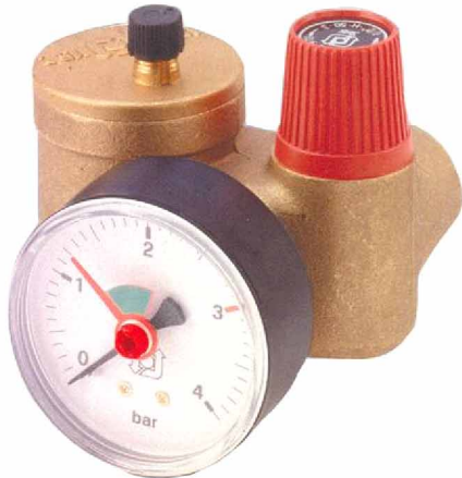
KSG 30 N