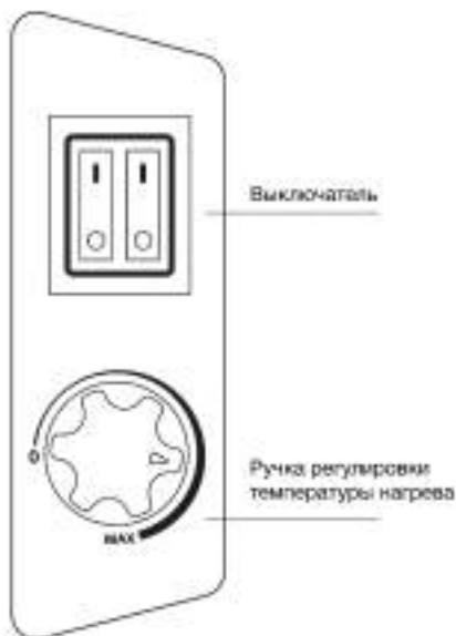
Рис. 2 Панель управления