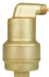
Spirotop Высокое давление Высокая температура