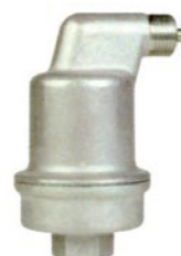
Spirotop Нержавеющая сталь