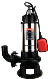
SUPERCUT - 1800