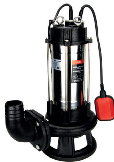
SUPERCUT - 2200