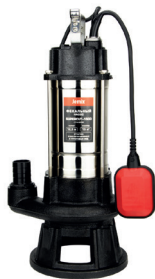
SUPERCUT - 1500