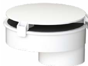
Filtercubic SFA Filtercubic XL SFA

Фильтры представляют собой угольные элементы в пластиковом корпусе и позволяют избавиться от посторонних неприятных запахов, которые могут образовываться во время работы насосной станции. При этом нет необходимости организовывать систему вентиляции резервуара насосной станции, монтаж которой иногда может быть очень трудозатратен и неудобен.