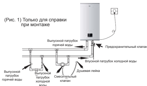
(Рис. 1) Только для справки при монтаже